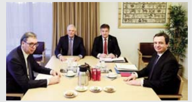
medie nga kryediplomati evropian Josep Borrell.

Pas takimeve është paralajmëruar deklaratë për