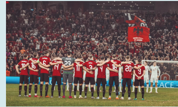
tifogrupit më të madh në mbështetje të Kombëtares shqiptare.

vetëm për të përkrahur dhe ngritur lart flamurin tonë, kuptojmë se jemi një komb i bashkuar dhe i palëkundur. Ne nuk jemi thjesht tifozë, jemi pasardhësit e një historie të lavdishme dhe një familje! Ne jemi Tifozat e Kuq e Zi", thuhet në postimin e