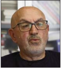
Shkruan: Behxhet Sh. SHALA – BAJGORA