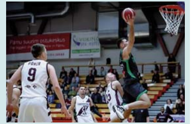
të luajë edhe kampionia e Kosovës, Peja.

Gravelines Dunkerque nga Franca. Përballja e parë dhe historike për klubin mitrovicës do të jetë kundër ZZ Leiden nga Holanda më 25 tetor në "Minatori". Kjo është hera e parë që "Xehetarët" janë pjesëmarrës të grupeve në FIBA Europe Cup. Në grupe do