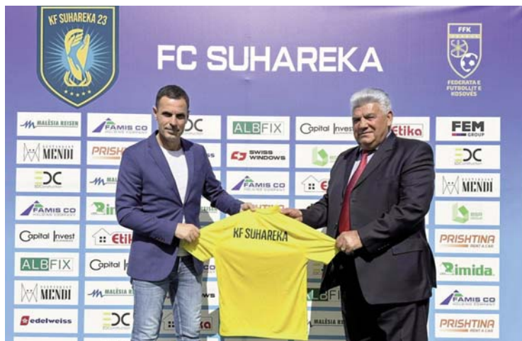
Drita, KF Malisheva", thuhet në njoftimin e skuadrës së Suharekës. Të mërkurën klubi do të udhëtojë