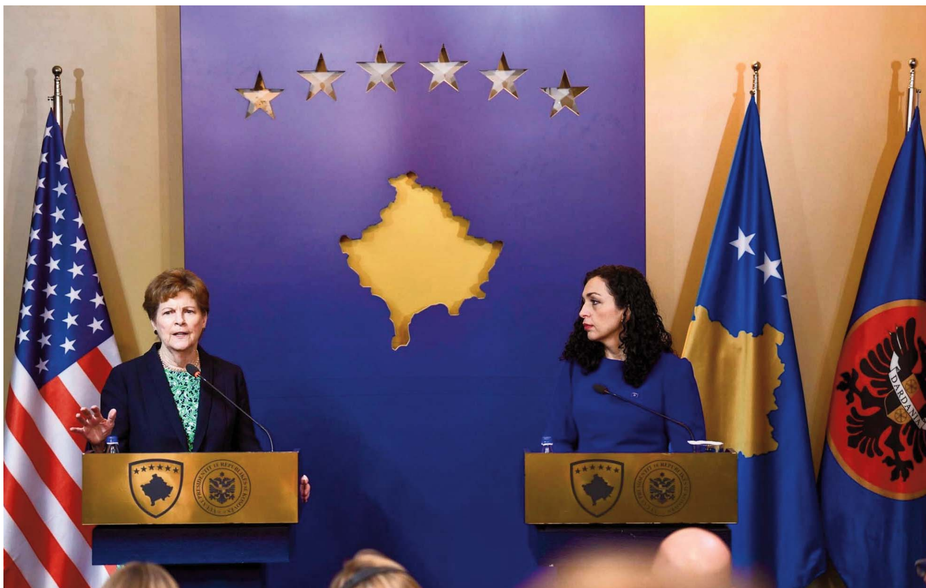
“AMERIKA QËNDRON ME KOSOVËN”, ISHTE MESAZHI QË SOLLËN NË PRISHTINË SENATORËT AMERIKANË JEANNE SHAHEEN DHE PETER WELCH