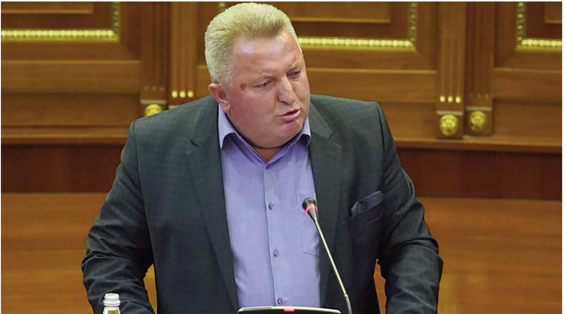
FLET PËR "EPOKËN E RE" DEPUTETI I PDK-SË, HISEN BERISHA