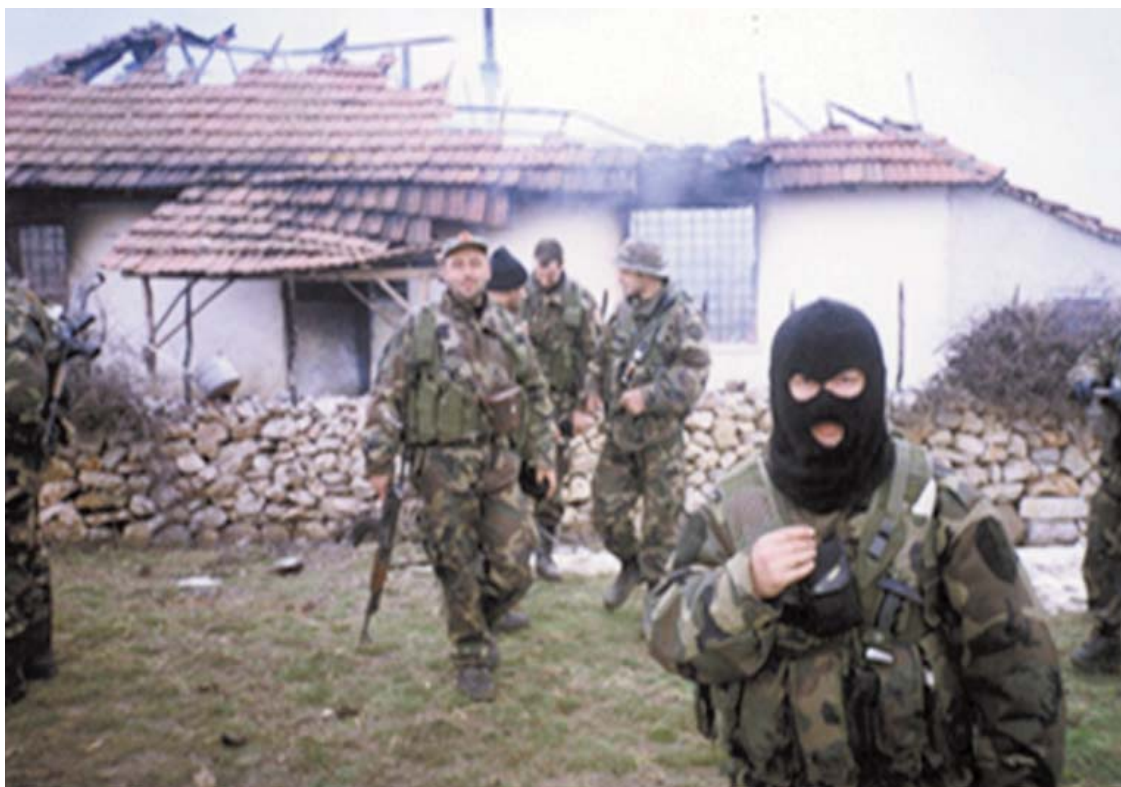
Foto: Kriminelë serbë të veshur me uniforma dhe emblemë të UÇK-së