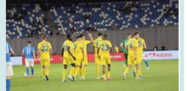
dytë në Grupin C me 3 pikë pas dy ndeshjeve të zhvilluara, kurse Astana është e fundit pa pikë.

rikuperohemi sa më shpejt të jetë e mundur", ka deklaruar trajneri i Astanas për faqen zyrtare të klubit. Ballkani dhe Astana do të përballen mes vete të enjten në Prishtinë duke filluar nga ora 18:45. Aktualisht kampioni kosovar e sheh veten në pozitën e