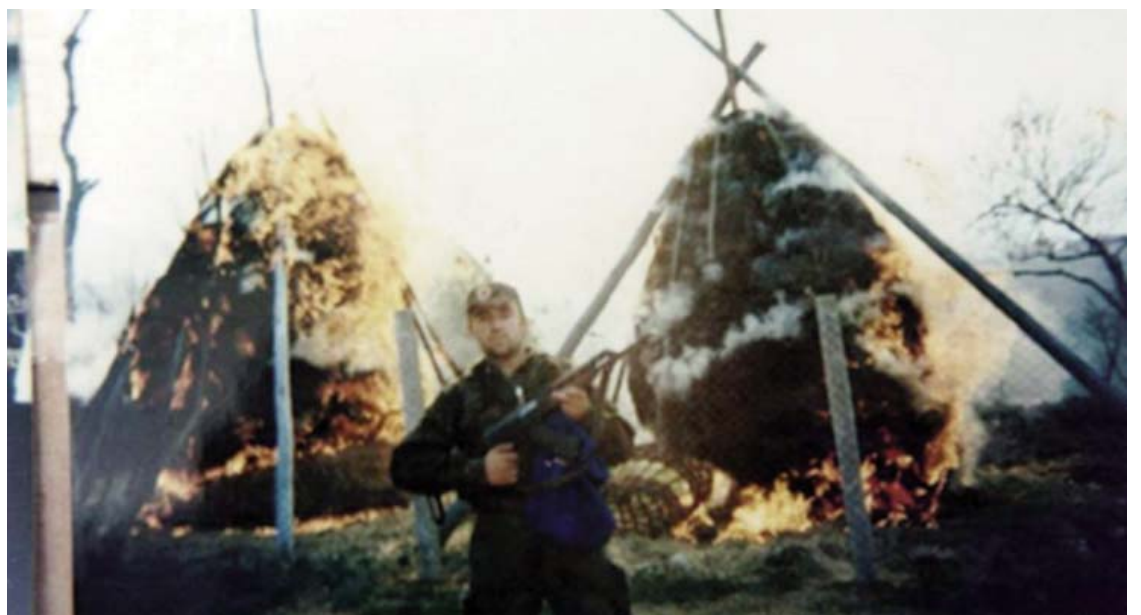
Foto: Kriminelë serbë të veshur me uniforma dhe emblemë të UÇK-së

që kishte dhënë për serbët e matanë lumit Drina, gjenerali Ratko Mladi i kishte dhënë mirënjohje të veçantë dhe, me udhëzimet e tij, si kolonel lufte, ishte dërguar në luftën e Kosovës në krye të Njësitit për Detyra të Veçanta!". Ai nuk tregon në cilat aksione ka marrë pjesë gjatë luftës në Kosovë por, siç shihet nga përzgjedhja që ka bërë të vendosë në ballinën e librit "Rrëfim-Ndoshta" fotografinë e vet me uniformë të UÇK-së, mund të supozojmë se të çfarë natyre ishin krimet e Njësitit për Detyra të Veçanta. Nuk mund ta di konkretisht në cilat krime ka marrë pjesë