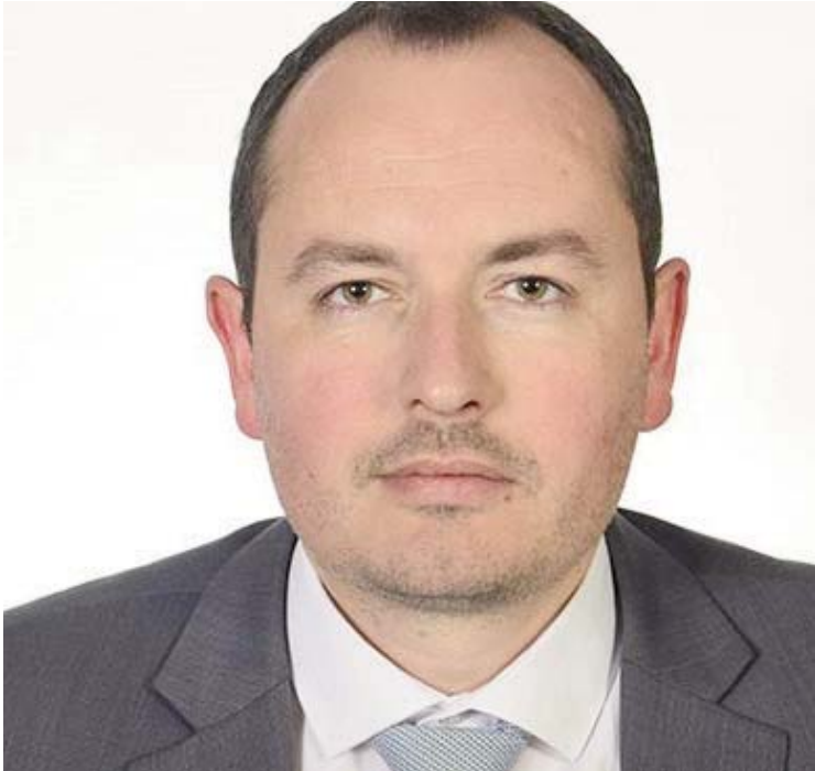
Shkruan: Elton TOTA