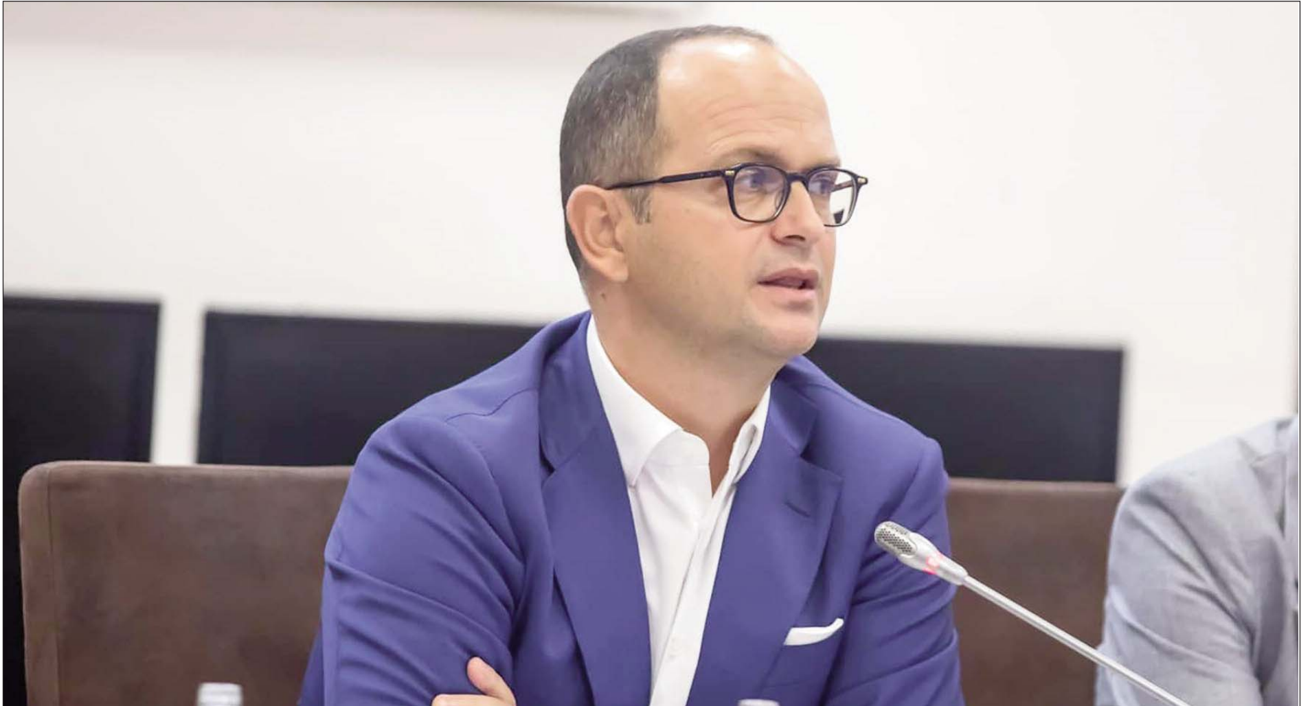
Shkruan: Ditmir BUSHATI, ish-ministër i Punëve të Jashtme i Shqipërisë

Bota u zgjua dje me imazhe të tmerrshme të sulmeve terroriste të Hamasit kundër Izraelit, të cilat me të drejtë u dënuan me ashpërsi nga e gjithë bota demokratike.