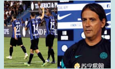
ndeshje pas ndeshje", u shpreh Inzaghi.

konstante. Doja që ai të luante pasi po rritet ndeshje pas ndeshje. Më vjen në mendje sfida në Bergamo, apo një tjetër ndeshje më herët. Nuk është e lehtë të futesh në këtë mënyrë në ndeshje të tilla. Asllani po më bind gjithnjë e më shumë,