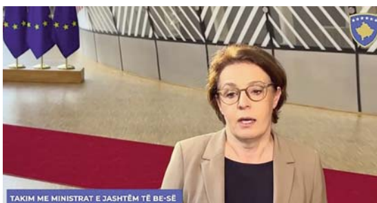
TAKIM ME MINISTRAT E JASHTËM TË BE-SË

Gërvalla kërkon reagim më të qartë të BE-së ndaj aktit të agresionit të Serbisë