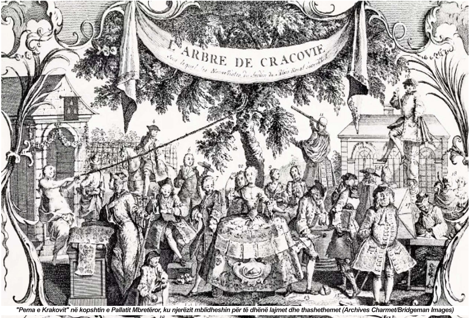
"Pema e Krakovit" në kopshtin e Pallatit Mbretëror, ku njerëzit mblidheshin për të dhënë lajmet dhe thashethemet