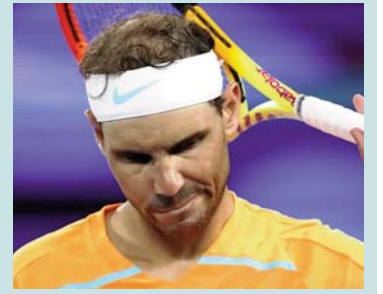
nuk luaj që një vit", ka deklaruar Nadal.

muaj që luftoj për këtë rikthim pasi besoj te vetja pavarësisht prej moshës. Karriera ime ka qenë shumë e gjatë dhe nuk e mohoj që vitet kalojnë. Djokoviçi ka fituar 24 grand slame dhe nuk besoj se do ta arrij. Është një objektivi që nuk e arrij dot. Jetoj në një realitet ndryshe nga e kaluara, pasi