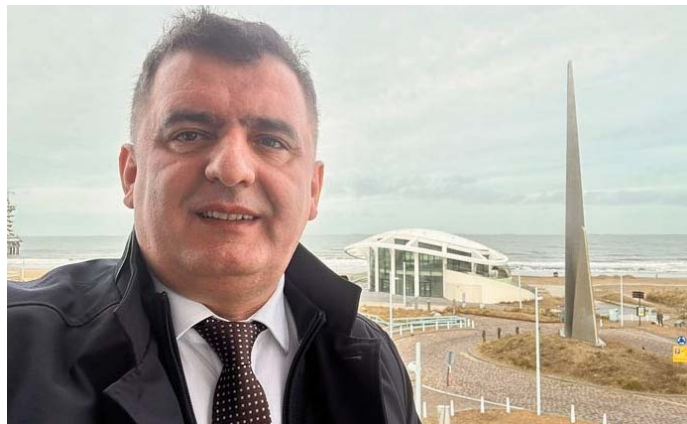
Shkruan: Sali BISLIMI

Siç është theksuar shumë herë, drejtësia e Hagës neglizhon të drejtat e mbrojtjes dhe parimin e procedurës së hapur.