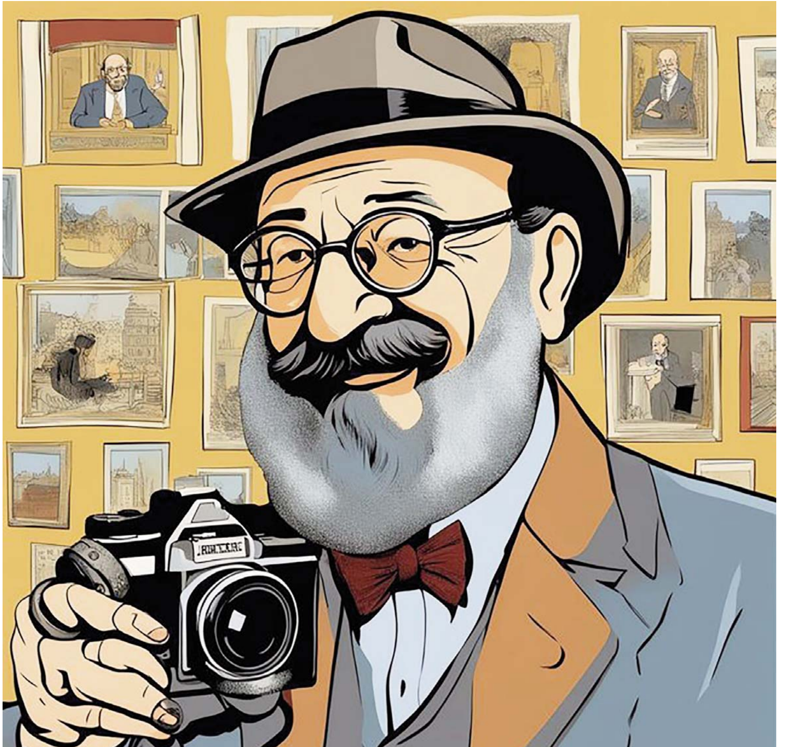
Ilustrim i portretit të Umberto Ekos (Umberto Eco) gjeneruar përmes inteligjencës artificiale (DeepAI)

Teksa ndërgjegjësohem për ngrohjen globale dhe zhdukjen e stinëve si pranvera e vjeshta, dhe këtë ma konfirmojnë artikujt të shkruar nga persona me autoritet, pyes veten se si do të reagojë nipi im, i cili ende nuk ka mbushur dy vjeç, kur të dëgjojë fjalën "pranverë," apo kur në shkollë të lexojë poezi për melankolinë e vjeshtës. Si do të reagojë ai në të ardhmen ndaj "Katër Stinëve" të Vivaldit? Ndoshta ai do të jetojë në një tjetër botë, me të cilën do të jetë plotësisht i mësuar dhe pranvera nuk ka për t'i munguar. Tek e fundit, si fëmijë, as unë nuk i kam parë e përjetuar dinosaurët e, prapëseprapë mund t'i përfytyroja. Ndoshta pranvera s'është veçse nostalgjia e një të moshuari, si ajo për netët e kaluara duke luajtur kukafshehti në strehët kundërajrore. Do të mundet vallë ky fëmijë i së ardhmes ta quajë normale jetesën në një botë ku virtyti kryesor do të jetë që të shihesh nga të tjerët; vlerë kjo, më e rëndësishme edhe se sa seksi apo paratë? Një botë ku njerëzit do të jenë gati të bëjnë gjithçka që të shihen në televizion ose çfarëdo mediumi që mund ta ketë zëvendësuar televizionin gjer atëherë, vetëm e vetëm që të jenë të njohur dhe të mos veprojnë nën peshën e frikshme e të papërballeshme të anonimitetit. Një botë ku gjithmonë e më shumë nëna të respektueshme do të jenë gati të rrëfejnë edhe historitë më të