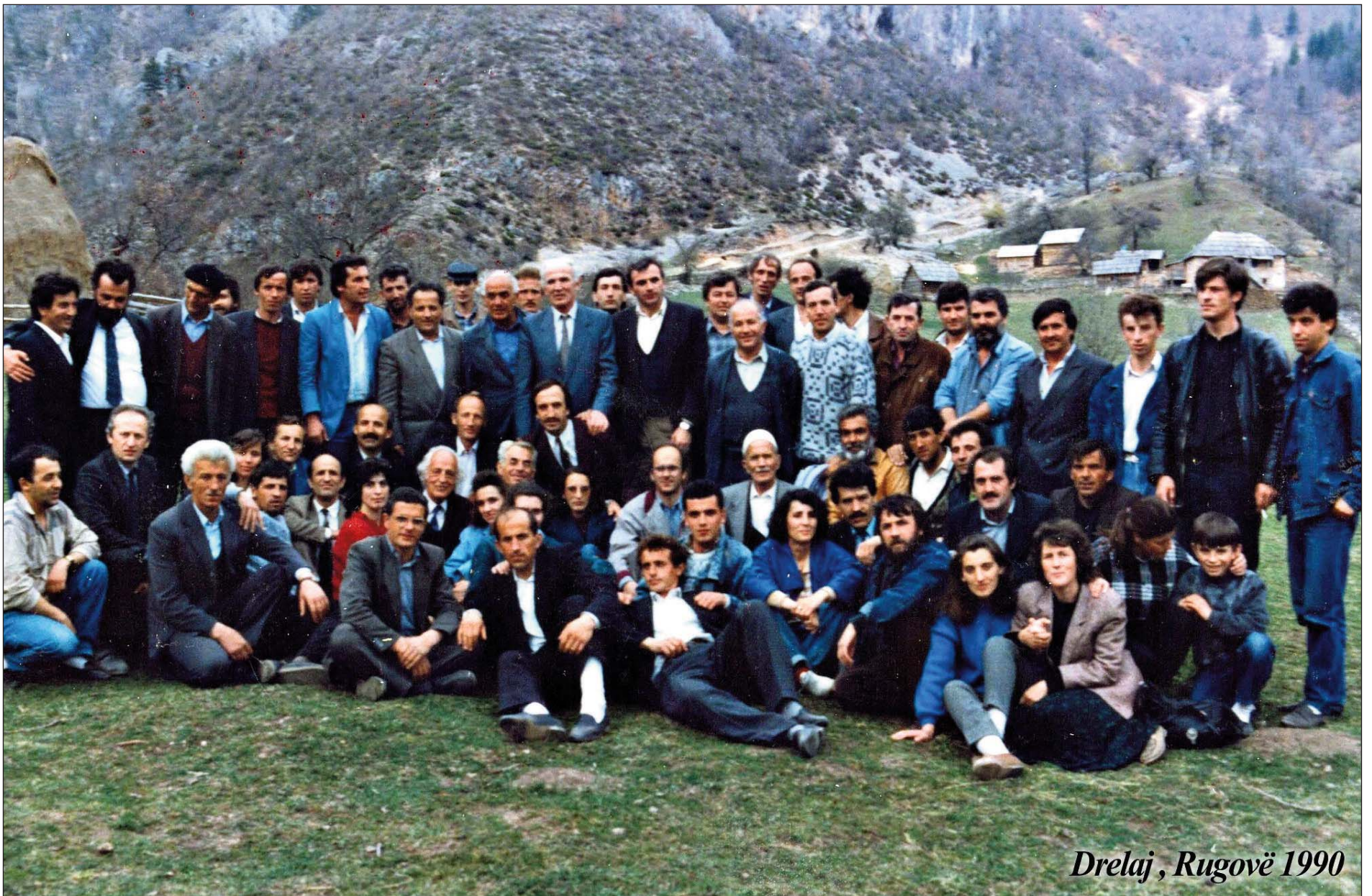
Drelaj, Rugovë 1990

(Punimi është botuar në revistën e Shkencave Albanologjike, “Studime albanologjike”, nr. 23, Shkup 2023. Fusnotat publikohen në fund të punimit/ VIJON)