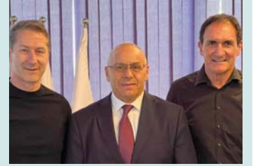
ta arritur suksesin dhe për të bërë më të mirën me Përfaqësuesen e Kosovës.