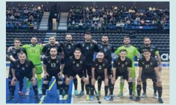
Lituania në periudhën 18 janar-8 shkurt 2026.

“play-off”, ku do të luajnë shanset për t’u kualifikuar në finalen e Evropianit të Futsalit. Ndeshjet e raundit “play-off” do të luhen më 15-24 shtator 2025, ndërsa finalen e Kampionatit Evropian të Futsalit do të organizohen nga Letonia dhe