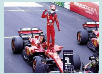
Jules Bianchi, mik i tij i ndarë nga jeta disa vite më parë pas një aksidenti.

bukur, me të vërtetë e veçantë, por edhe e vështirë", është shprehur Leclerc. "Dy xhirot e fundit, kur dola nga tuneli, u përpoqa të shihja sepse sytë më ishin turbulluar nga lotët. Kisha frikë se mos gaboja pikërisht në fund", kujton Leclerc. Monogasku i dhuroi kokoren e asaj garës ish-pilotit