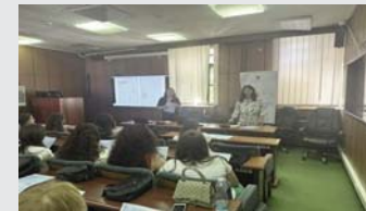
mbledhura gjatë procesit të regjistrimit.

Informatat e mbledhura nga pyetësori i APR-së shfrytëzohen për vlerësimin e mbulueshmërisë si dhe për kontrollimin e cilësisë së karakteristikave të përzgjedhura e të