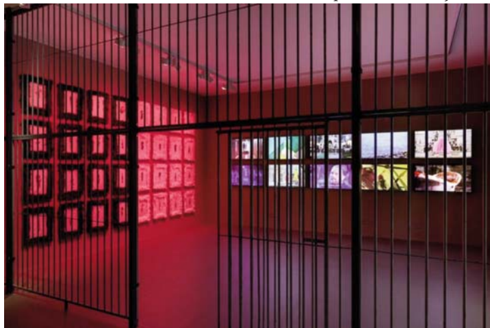
Qelia e izolimit