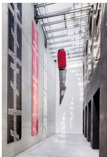
Shpata e Demokleut, instalacion nga Nadya Tolokonnikova