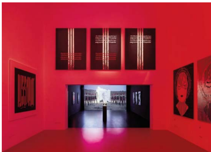
Kapella e tërbimit me pamje nga Hiri i Putinit

muzikore të Pussy Riot, përfshirë atë gjatë Lojërave Olimpikë Dimërore të Soçit më 2014. Gjatë asaj kohe, thotë Tolokonnikova, ajo jetoi në frikë të vazhdueshme. "Njerëzit thjesht kalonin pranë dhe na goditnin me grusht ose na hidhnin antiseptik në fytyrë", thotë ajo. "Kam pasur sulme paniku në metro." Kjo frikë është e dukshme në një vepër tjetër, "Shpata e Demokleut". "Çdo qeveri shtypëse autoritare është thikë me dy tehe", thotë Tolokonnikova. "Ka rrezik për ne aktivistët ... por, ka edhe rrezik për diktatorin. Putini e ka rrethuar veten me armiq dhe për çdo krijon më shumë armiq". Përkthim (i pjesshëm): Telegrafi.com