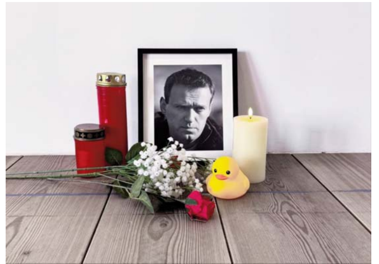
Portreti i Alexei Navalnyt n° ekspozitë

Vizitorët mund të shohin anën tjetër të dhomës, përmes shufrave të çelikut. Aty ekranet shfaqin video të projekteve dhe protestave