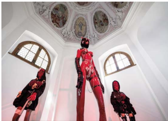
Kukullat e seksit