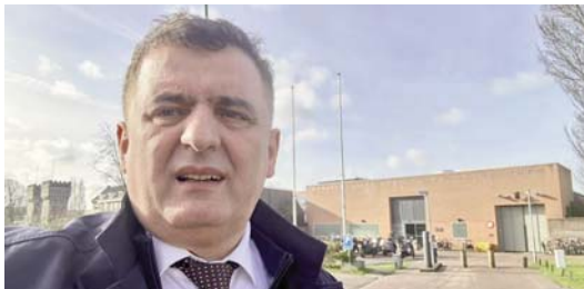
Shkruan: Sali BISLIMI

Haga duhet të korrigojohet, të kërkojë falje | PAGE 4