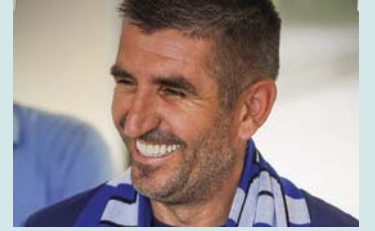
Prishtinës dhe atë të Dukagjinit nga Klina.