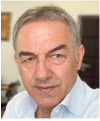
Shkruan: Faton ABDULLAHU

VV-ja është formësua si parti politike jo duke u ballafaquar me Serbinë, por duke u ballafaquar me institucionet e Kosovës, me partitë politike shqiptare të Kosovës dhe me faktorin ndërkombëtar. Kjo karakteristikë e trashëgimisë politike e VV-së hetohet gjithanshëm e kjo mund të parafrazohet me atë të njohurën "VV nuk e dinë çka është Serbia". Ajo me Serbinë po ballafaqohet vetëm për aq kohë sa është në pushtet dhe ate përmes dialogut. Me këtë mendësi VV-ja e ka vendosur kështu Serbinë, në pozitën më të mirë në arenën ndërkombëtare në të cilën ka qenë ndonjëherë që nga përfundimi i luftës.