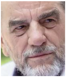
Shkruan: Milazim KRASNIQI

Edhe nga zhvillimet e kohëve të fundit nxirret lehtë përfundimi logjik se Kosova as nuk ka pasur as nuk ka politikë të qartë lidhur me serbët e Kosovës e aq më pak për