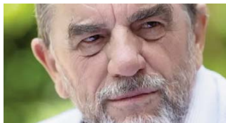
Shkruan: Milazim KRASNIQI

A PO NXITET NJË KONFLIKT I RI I ARMATOSUR F.7