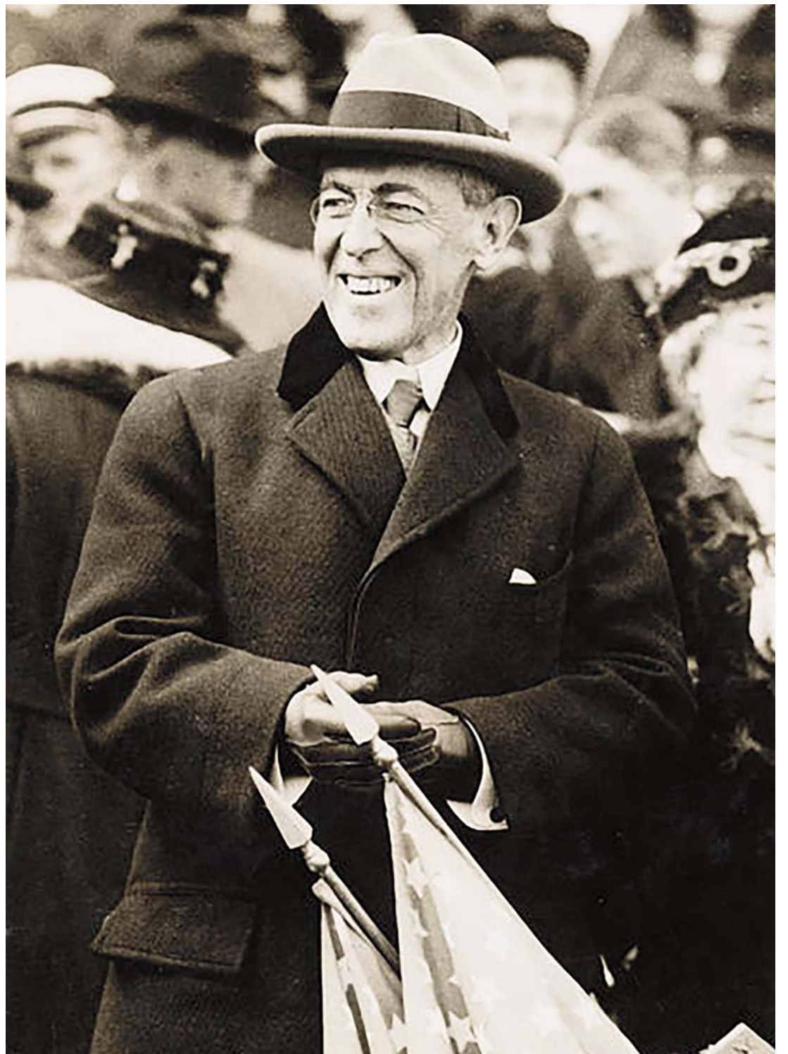
Ish-Presidenti amerikan Woodrow Wilson

Në zgjedhjet e 2024-s, pavarësisht se kush do të fitojë këto zgjedhje, demokratët apo republikanët, është pak e mundshme të ketë ndryshime të mëdha në këtë politikë. Të dyja partitë zakonisht ndajnë qëndrimin e njëjtë për çështjet e sigurisë dhe stabilitetit në Ballkan, përfshirë përpjekjet për normalizimin e marrëdhënieve midis Kosovës dhe Serbisë përmes dialogut të lehtësuar nga BE-ja dhe mbështetjen për përpjekjet euro-atlantike të rajonit.