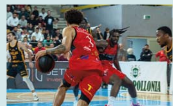
tri humbje, derisa Vëllaznimi tri fitore e katër humbje.