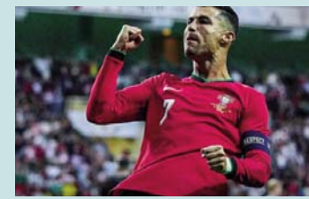
lojtari me më shumë gola në histori, kështu që është mirë".

të arrijë 1000 gola në karrierë, por CR7 "fajëson" veten se e ka ngritur stekën shumë lart: "Do të jem i singertë, është faji im, sepse tani e shoh jetën si ta jetoj në këtë moment, nuk mund të mendojmë gjatë. Dua të shijoj të tashmen. Vetë thashë se doja të arrija 1000 gola, por nuk e di nëse do t'ia dal. Megjithatë, jam ende