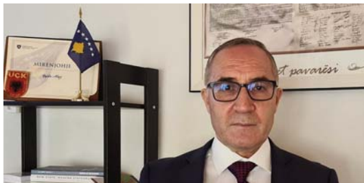
Shkruan: Hajdin ABAZI