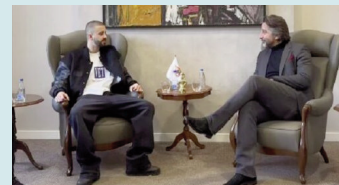
disa klube të mëdha evropiane.

ndërkombëtare. Kryeqyteti gjithmonë mbështet kampionët e saj", ka shkruar Rama në "Facebook". Zhegrova momentalisht është një nga futbollistët më të mirë në Evropë. Atë po e kërkojnë