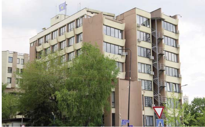
Prej përfundimit të luftës së fundit në Kosovë rreth 70 persona janë dënuar për krime lufte para institucioneve

pjesëtarë të tjerë të paidentifikuar të këtij grupi, të armatosur dhe të veshur me uniforma të kamufluara dhe uniforma jo të rregullta të policisë apo ushtrisë serbe, i kishin rrahur, maltretuar, torturuar, plaçkitur dhe dëbuar civilët shqiptarë gjatë luftës, sipas aktakuzës. Të pandehurit M. Sh. dhe N. S. akuzohen edhe për armëmbajtje pa leje, thuhet në aktakuzë. Dhjetorin e kaluar Prokuroria Speciale e Kosovës kishte thënë se ka ngritur gjithsej 33 aktakuza, që përfshijnë 89 persona, për krime lufte në Kosovë.