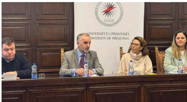
kësaj përvoje të ndarë nga partnerët tanë", tha rektori