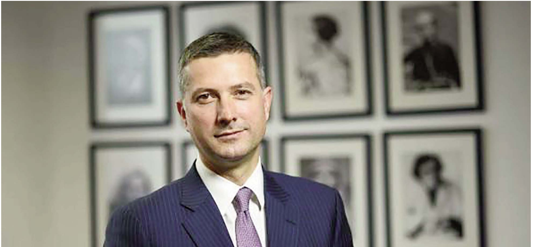
Shkruan: Bekim ÇOLLAKU

Sa më shumë po afrohen zgjedhjet parlamentare, aq më tepër po shtohen tensionet në veri të Kosovës. Këto zhvillime, që kulmuan me një akt tjetër terrorist kundër asetëve vitale të Kosovës, kuptohet që janë të qëllimshme dhe synojnë destabilizimin e vendit tonë. Nuk ka dyshim, fajtoreshë mbetet Serbia ose Rusia. Përderisa teoritë e tjera konspirative mbesin të hapura, shtrohet pyetja se përveç Serbisë dhe Rusisë, kujt tjetër i përshtatet një përkeqësim i tillë i situatës së sigurisë në prag të zgjedhjeve parlamentare në Kosovë?