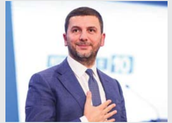
vendosmërisht", ka shkruar Krasniqi në "Facebook".

Partisë Demokratike të Kosovës në grupimin politik të partive liberale-demokratike të Evropës - ALDE, para fiks dy vjetësh. Parimet themelore liberale të lirisë, demokracisë, shtetit të së drejtës, të drejtave të njeriut, tolerancës dhe solidaritetit, janë vlera, mbi të cilat PDK qëndron