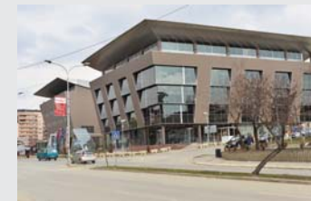
përmbyllin suksesshëm këtë proces do ta përfitojnë shtesën e performancës.

Aplikimi mund të bëhet përmes platformës e-kosova nga 4 deri më 19 dhjetor. Të gjitha ato/ata që do ta