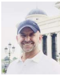
Shkruan: Astrit GASHI

Në prag të zgjedhjeve të 9 shkurtit partitë politike në Kosovë kanë hyrë në garë pa funksionalizuar forumet e tyre rinore. Kjo u dëshmuar qartë në hapjen e fushatave të të gjitha partive, ku mungesa e zërit dhe përfaqësimit të rinjve ishte evidente. Zëri i tyre nuk u dëgjua askund. Edhe pse disa drejtues të rinisë figurojnë në listat për deputetë, forumet rinore janë praktikisht joaktive dhe mungojnë në çdo aspekt të veprimitarisë politike të