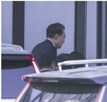
Rojet e tij kishin vendosur tela me gjemba dhe barrikada në

ta shmangur "derdhjen e gjakut". Si një ish-prokuror që udhëhoqi Partinë Konservatore të Fuqisë Popullore (PPP) drejt fitores në zgjedhjet e vitit 2022, Yoon mund të përballet me dënim me vdekje ose burgim të përjetshëm nëse shpallet fajtor për kryengritje. Ai kishte tentuar ta shmangte arrestimin për javë të tëra duke qëndruar në rezidencën e tij, i mbrojtur nga anëtarët e Shërbimit të Sigurisë Presidenciale (PSS) që i kishin qëndruar besnikë.